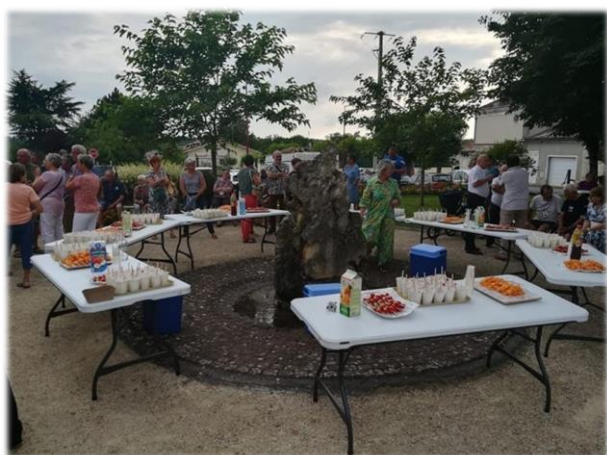
2 juillet 2021, place Cécile Magni : un moment de convivialité apprécié

★ La Fête des Vendanges a été organisée par le Comité d'Animation avec une belle participation à la soirée Tapas du samedi soir. La météo a compromis le concours de pétanque du samedi après-midi, mais le feu d'artifice de 23h a bien éclairé les abords de la salle des fêtes.